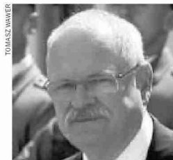
Prezydent Słowacji Ivan Gašparovič