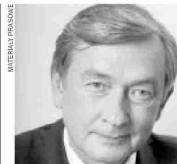
Prezydent Słowenii Danilo Türker