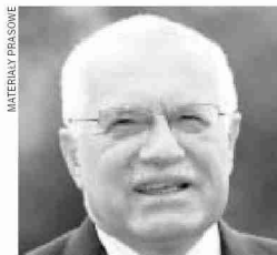
Prezydent Czech Vaclav Klaus